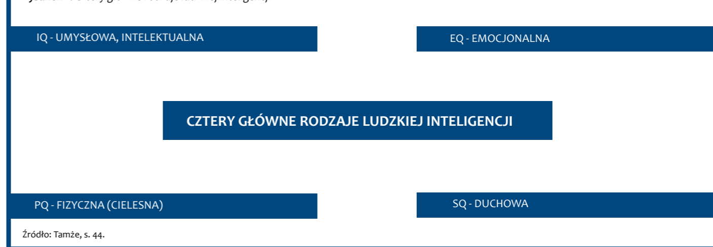
Rysunek 2. Cztery główne rodzaje ludzkiej inteligencji

Jednym z podstawowych warunków skutecznego uczenia się jest rozwój głównych rodzajów inteligencji.