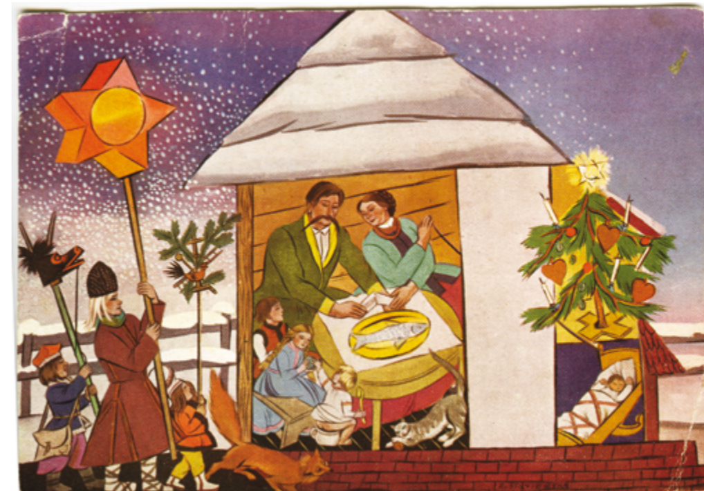
il. 1 Archiwum Naukowe Państwowego Muzeum Etnograficznego w Warszawie, sygn. Arch. PME I. 15590

W czasie przeglądania archiwaliów moją uwagę przykuła pocztówka, która ukazuje spotkanie przy wigilijnym stole. W plastyczny sposób przedstawiono na niej wartość pojednania, potrzebę emocjonalnej bliskości i jeszcze jedną wartość, tak ważną dla trwania wspólnoty narodowej, wartość rodziny. Na obrazku widzimy żonę, męża, dzieci w czasie skromnego wigilijnego posiłku. Klimat bliskości oraz atmosfera rodzinności nasuwają myśl o potrzebie i konieczności okazywania innym pozytywnych uczuć, o potrzebie dawania dobra.